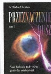
▲ Przeznaczenie dusz tom 1 , Michaela Newton