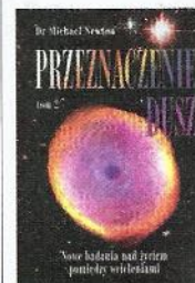
▲ Przeznaczenie dusz tom 2 , Michaela Newton

Książki do nabycia m.in. w Magazynie Wysylkowym, tel. 22/620 08 05, w Galerii przy ul. Twardej 7 w Warszawie oraz Sklepie Internetowym www.sklepkormoran.pl