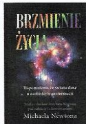
▲ Brzmienie życia , Michaela Newton

W czasie sesji LBL twój Przewodnik Duchowy może zabrać cię do miejsca, gdzie zaplanowałaś swoje życie. Wtedy dowiadujesz się i uświadamiasz sobie wszystkie pytania: „DLACZEGO?”. To DLACZEGO napisane wielkimi literami umożliwia ci przeanalizowanie przebiegu całego twojego życia. W czasie sesji hipnotycznej możesz również znaleźć się w przestrzeni, w której doświadczasz wydarzeń ze swojego poprzedniego istnienia i powtarzających się tematów, nad którymi pracujesz z perspektywy Duszy. Dzięki tym wglądom bardziej świadomy staje się cel twojego życia. Wtedy łatwiej akceptujesz wydarzenia i tak zwane przypadkowe sytu-