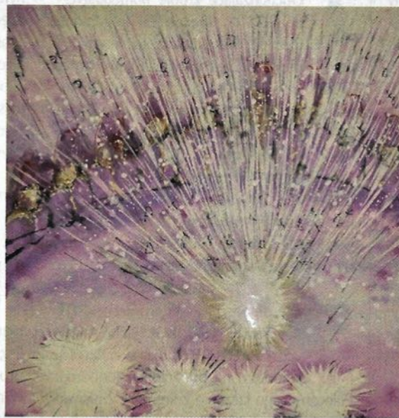
Fragment akwareli Spotkanie z Radą Starszych

Dusza, współpracując w świecie Dusz ze swoim Przewodnikiem Duchowym, planuje tematy, ażeby je przepracować i ich doświadczyć, móc